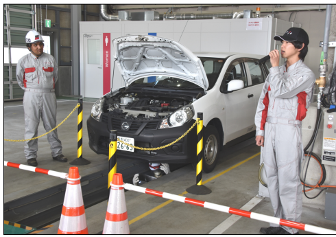
下降型フロアリフトピット完備の車検設備

最先端テクノロジによる設備 重機の車検工場は最新の下降型フロアリフトピットを備えており、作業員が立ったまま安全に車体の下部作業を行うことができる。整備品質の向上とスピードアップで安定供給を強化しているという。また車体の清掃作業は機械化されており、自動車洗浄ラインでは14本の強力なノズルにより、短時間で高品質な洗浄が可能となった。