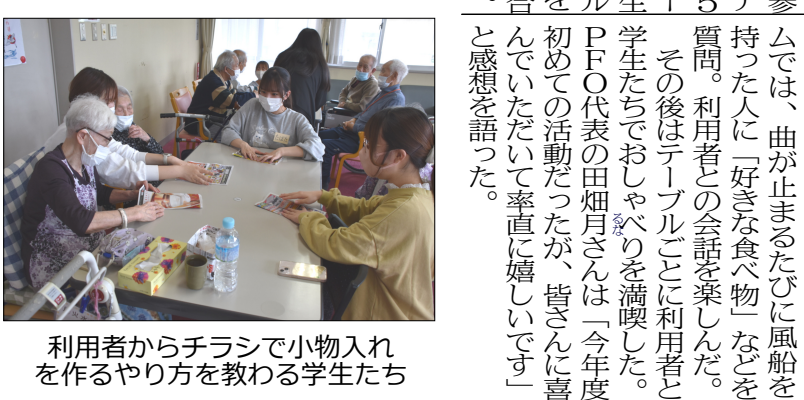
風船を使ったゲームで交流 利用者からチラシで小物入れを作るやり方を教わる学生たち

戸上デイサービスセンター 長野大学ボランティアサークルと高齢者が交流 千曲市内の福祉イベントなどに参加している長野大学ボランティアサークル「PFO」のメンバーが5月24日、戸上デイサービスセンターを訪れた。今回は1年生と2年生を訪問した。今回は1年生と2年生を訪問した。今回は1年生と2年生を訪問した。今回は1年生と2年生を訪問した。