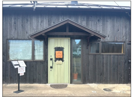
Cafeかすみ草 定休日:火・水曜日 住所:千曲市小島3050-2

さらに魅力的だったのは、ドリンクメニューの豊富さ。私が注文したクリームソーダ以外にも、ソーダ系や紅茶、ラテなど種類が多くその日の気分