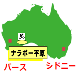
ナラボー平原 パス シドニー