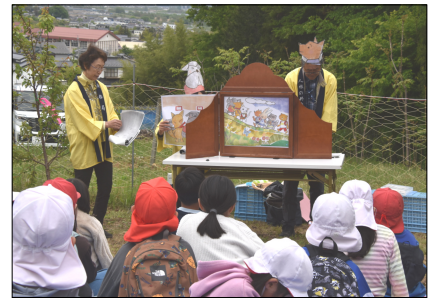
いじめをテーマにした紙芝居を上演