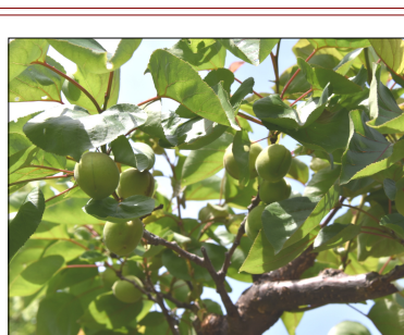
たわわに実ったあんずの実