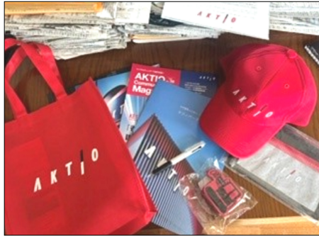
街のために貢献！アクティオのナバルティ（お披露目会での記念品）

お披露目では写真のようなアクティオのロゴ入りの赤いキャップ、メジャー、3色ボールペン、赤いバックなどが配られた。