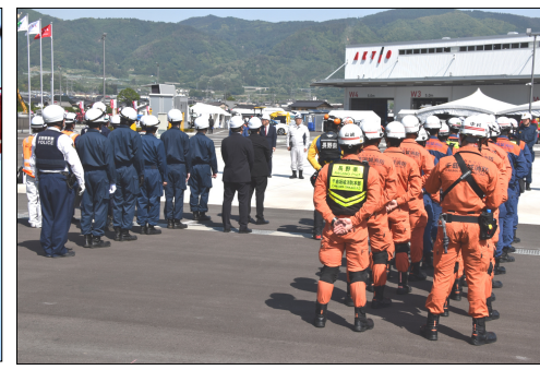
千曲市官民連携防災訓練開始式

千曲市とアクティオ 包括連携協定 官民連携の防災訓練を実施 県防災ヘリ「アルプス」も参加 「【第4～5面に関連記事】」