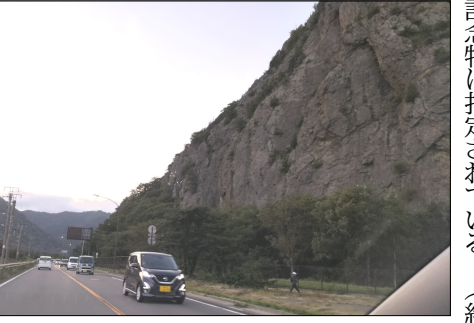
岩鼻の険(下塩尻岩鼻)

元々下塩尻岩鼻と半過岩鼻は繋がっていたが千曲川の急流で削られて分離した。地質調査によつて塩尻方面には湖の痕跡が確認されている(塩尻の地名は「潮尻」が語源)。その記憶を反映したとみられる伝承が遺されており、軋良根古神社の鼠退治伝説では、唐猫に追い詰められた化け鼠が岩山を食い破つたため湖の水が流れ出して千曲川となったとされている。また、上田方面の民話に登場する「小泉小太郎」が岩鼻を破つたという言い伝えもある。 下塩尻岩鼻は虚空蔵山(標高1076m)の北端に位置し、尾根には戦国期に虚空蔵山城や和合城など数々の山城が築かれた。また本州ではここにしか群生していないモイワナズナなど貴重な自然が存在し、下塩尻及び南条の岩鼻は県指定の天然記念物に指定されている。(続)