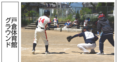
戸倉体育館グラウンド