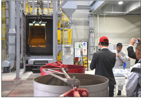
重機部品用のショットブラスト設備

5月13日、アクティオの北信越エリアの拠点となる統括工場、長野ちくまテクノパークのお披露目会が開催された。既に工場は稼働中で昨年10月29日に竣工式が執り行われていたが、報道メディア向けの公開はこれが初めてである。