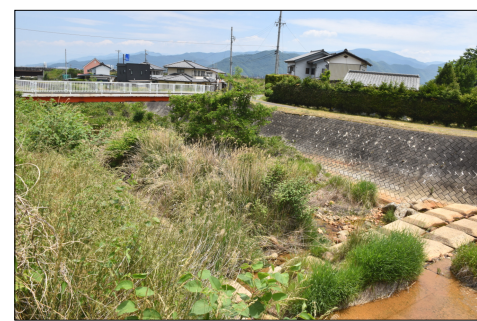
クマが捕獲・駆除された佐野川