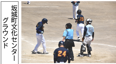
坂城町文化センターグラウンド

選手9人の合計年齢が450歳以上のチームによる「寿野球全国大会」が5月10日に開催された。昭和51年(1976)に当時の更埴市で始まった大会は今回が第51回。毎年千曲市と坂城町の球場で試合が行われており、今年は県内から20、県外から18のチームが参加した。全国から集まった熟年プレーヤーたちは野球少年のころのように楽しみながら元気よく白球を追いかけていた。