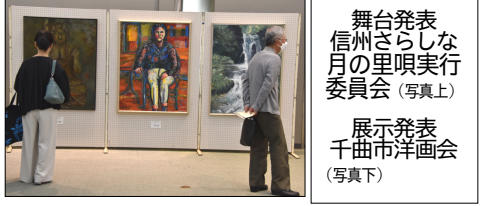
舞台発表 信州さらしな月の里実行委員会 (写真上) 展示発表 千曲市洋画会 (写真下)

5月9日から10日まで信州の幸あんずホールで第17回千曲市総合芸術祭が開催され、市内の文化芸術団体が舞台発表や作品の展示を行った。今年の芸術祭のテーマは「彩(いろどり)」。