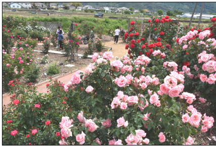
初日はさる回しショーも上演された

初夏の千曲川河川敷を彩る風物詩、信州坂城町ばら祭りが5月23日に開幕。会場のさかき千曲川バラ公園に大勢の来場者が詰めかけた。今年で21回目の開催となる坂城町のばら祭り。開会式は強い風が吹く青空のもと執り行われた。初日から多くの品種のバラが咲き誇り、園内に鯉のぼりも設置。訪れた人たちは思い思いにカメラを向け写真に収めていた。こども向けに園内に隠されたキーワードを探すスタンプリーも行われた。坂城町ばら祭りは入場無料だが自動車での来場の際は協力金500円が必要となる。期間中の土曜日と日曜日はなしの鉄道坂城駅、テックノさかき駅と会場を結ぶシャトルワゴンが運行。最終日の6月7