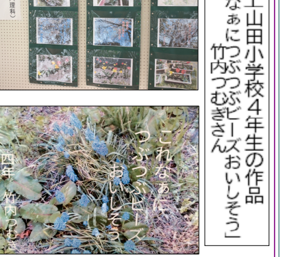
「これなあに? つぶつぶおもしろい!」

戸上デイサービスセンター 長野大学ボランティアサークルと高齢者が交流 千曲市内の福祉イベントなどに参加している長野大学ボランティアサークル「PFO」のメンバーが5月24日、戸上デイサービスセンターを訪れた。今回は1年生と2年生を訪問した。今回は1年生と2年生を訪問した。今回は1年生と2年生を訪問した。今回は1年生と2年生を訪問した。