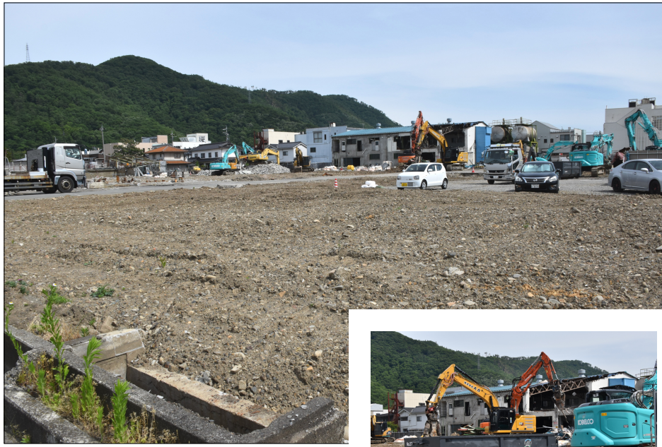
敷地内の解体作業が進んだ日本デルモンテ長野工場の跡地 (撮影 5月25日)