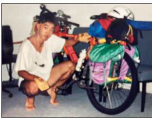
出発前日、友人の寮の部屋で。

毎日変わらない景色の中で、サイクルコンピューターの積算距離を頼りに、走行距離を稼いで行く。そんな日々を繰り返しながら、少しずつシドニーに近づいて行くのだった。旅はようやく隣のサウスウェールズ州に入ったばかり。東西を繋ぐナラボー平原の途中である。これからアデレード、メルボルンを抜けて、旅のエピソードはまだ続いて行く。スマホなど無かった在し日の旅の記録に、もうしばらくお付き合い願いたい。