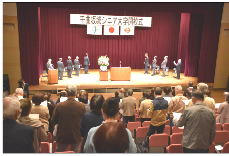
開校式で「信濃の国」を斉唱

に還元してほしい」と語りかけた。開校式終了後にはオリエンテーションが行われ、今年度の講義内容の紹介や受講時の注意点などが説明された。また、千曲市や坂城町の社会福祉協議会で行っているフードドライブへの協力も呼びかけられた。今年の講座科目は5月8日の富士見高原医療福祉センターの高木院長による認知症講座からスタートした。