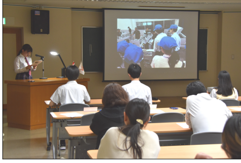
高校生による報告の様子