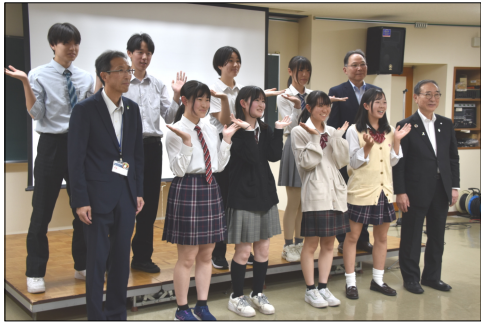
研修に参加した8名の高校生

今回は7つの高校(屋代、屋代南、上田染谷丘、上田千曲、上田西、長野南、坂城)から8名が参加。一行は3月22日の早朝に坂城町を出発し、夜タイ国シーラチャに到着。翌日都築製作所、アルプスツール、水野製作所の3社の現地工場を視察し、その後アユタヤに移動。翌24日に世界遺産のアユタヤ遺跡を見学した後、首都バンコクの日本大使館を訪問。25日は引き続き市内で寺院や王宮など見学して、地元タイの高校生と交流。26日の朝日本に帰国した。報告会では金型工場「品質を守る高い意識が感じられた。この様な作業の積み重ねが高品質な製品作りにつながっているのだと思う」という感想や、タイならではの文化に触れて「違いを知ることで自分の考えが広がった」といった声が聴かれた。