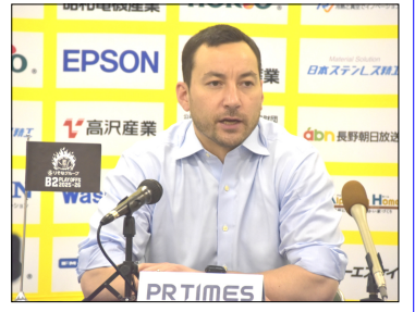
クォーターファイナル v s 福井ブローウィンズ (5月2日) セミファイナル v s 福島ファイヤーボンズ (5月9日)

B2プレーオフが5月1日から行われ、東地区1位の信州BWはクォーターファイナルを突破してセミファイナルに進出したが、福島に1勝2敗で敗れた。3位決定戦は横浜に連敗し、ラストイヤーのB2リーグでの最終順位は4位となった。来季から戦いの舞台は「Bプレミアリーグ」へと移る。